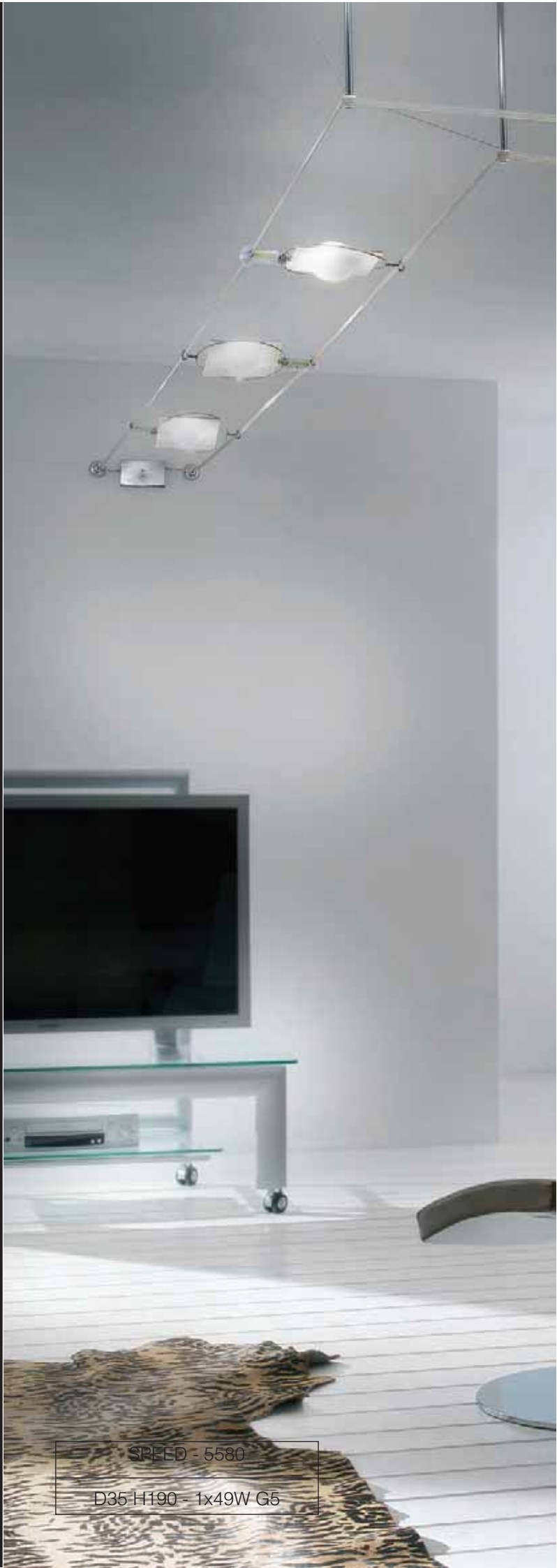
SPEED - 5580 D35 H190 - 1x49W G5