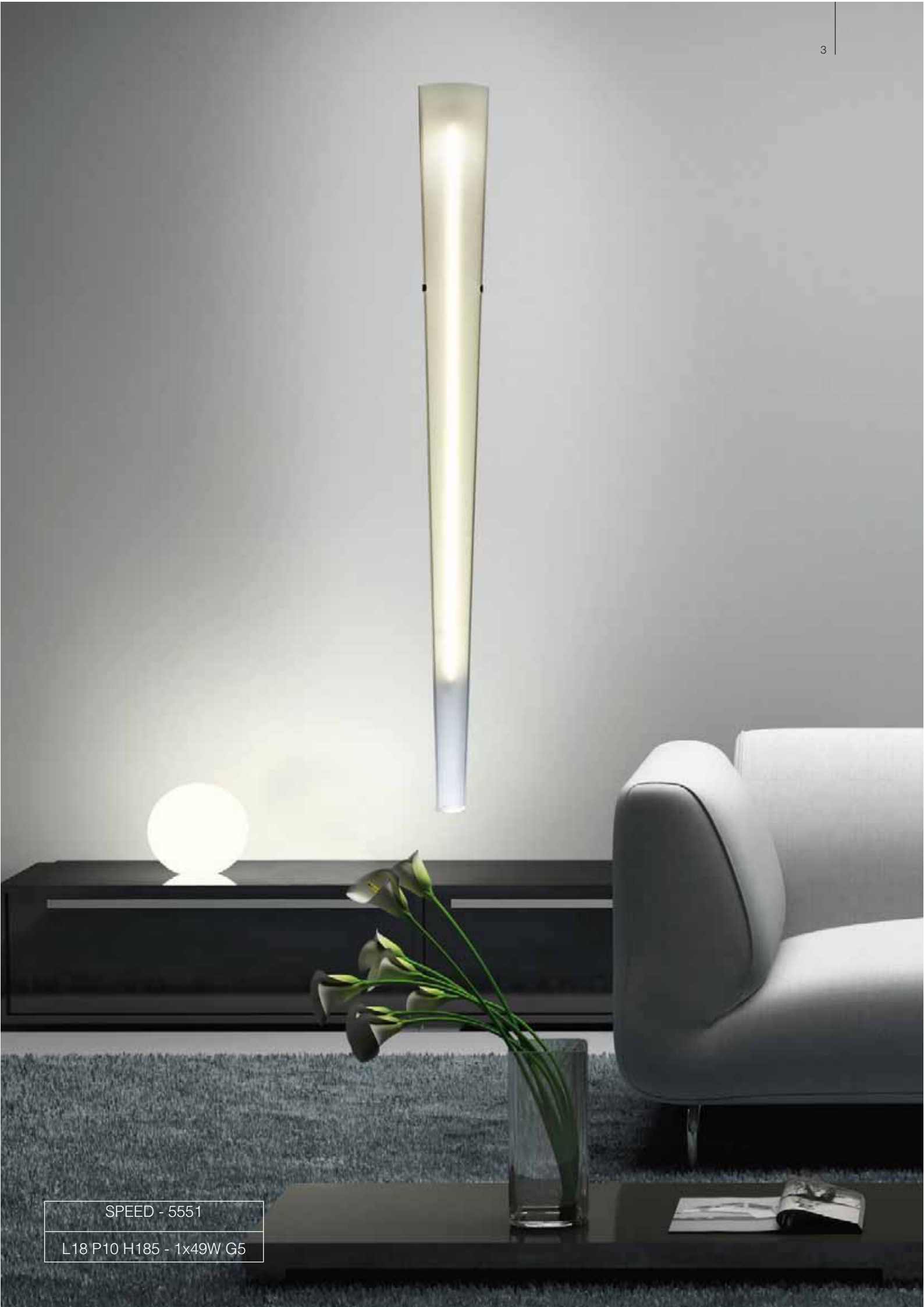
SPEED - 5551